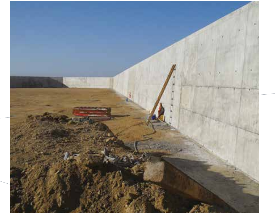
Akaryakıt Dolum ve Depolama Terminali Gas Filling and Storage Terminal